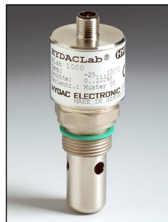
Slika 6. Multi senzor HYDACLab