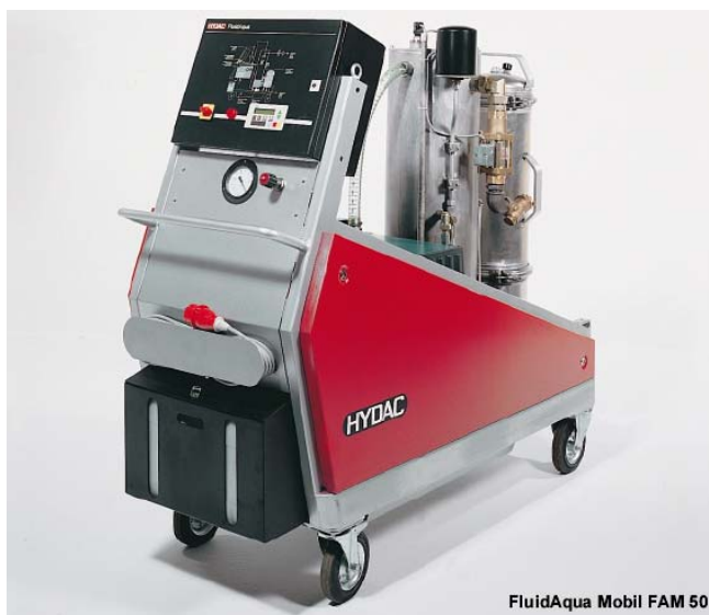
Slika 8. Agregat za kondicioniranje ulja FluidAqua Mobil FAM 50