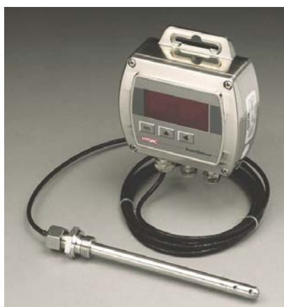
Slika 5. AquaSensor 2000