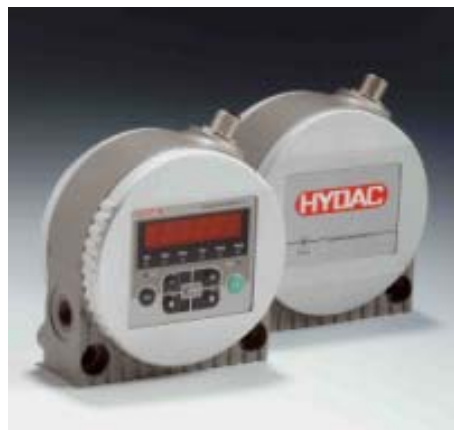
Slika 3. Automatski brojač čestica za fiksnu ugradnju