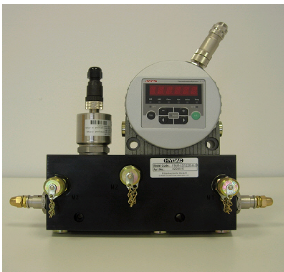
Slika 7. FMM blok sa multisenzorom HYDACLab i automatskim mjeracem čestica CS1000

ulja. Opremljen je sa mjerno-kontrolnim uređajima, koji prate stanje ulja u sistemu, te ga po potrebi samodejno aktiviraju.