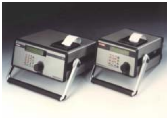
Slika 2. Automatski prenosni brojač čestica

Za primjenu u praksi se uobičajeno koriste automatski brojači čestica (slika 2, slika 3), prenosni ili fiksno ugrađeni, koji funkcioniraju na principu prigušivanja svjetlosti. Sa njima se može vrlo precizno odrediti razred čistoće u skladu s ISO 4406:1987, ISO 4406:1999, NAS 1638 i SAE AS 4059.